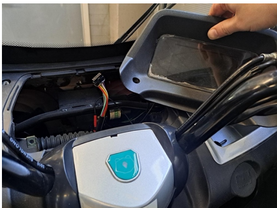
Siirrä mittaristo sivuun.