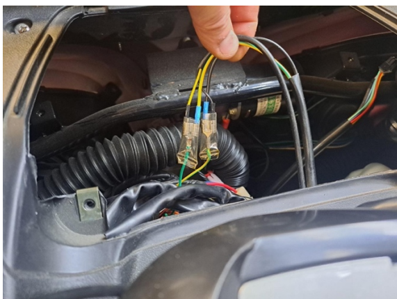
Avaa etujarruvivun mikrokytkimen liittimet.