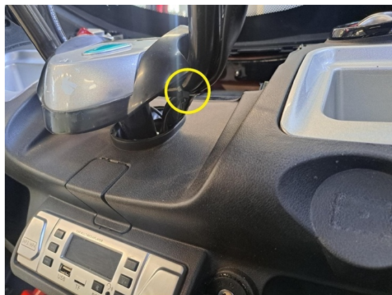
Katko etujarruvivun mikrokytkimen johtoa kiinni pitävät nippusiteet. (sivuleikkurit).