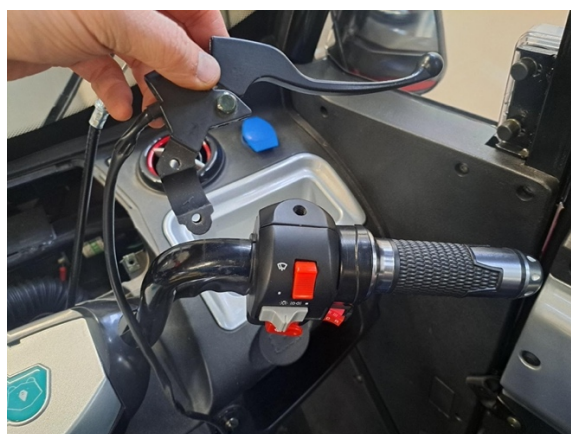
Ota etujarruvipu pois.

Uuden osan asennus käänteisessä järjestyksessä.