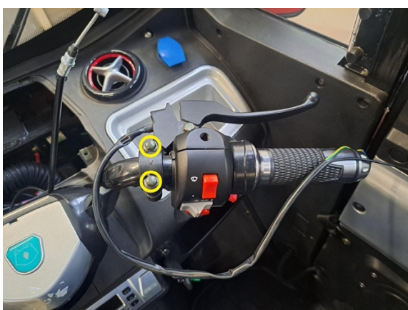
Irrota etujarruvivun kiinnityspultit. (hylsy 8 mm).