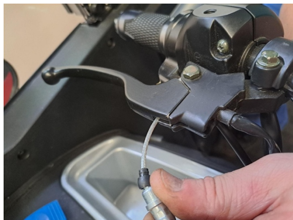
Irrota etujarruvaijeri etujarruvivusta.